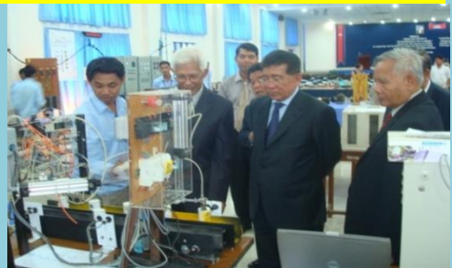
ក្រោមអធិបតីភាព ឯ.ឧ អ៊ឹម សិទ្ធិ រដ្ឋមន្ត្រីអប់រំ តាំងពិពណ៌បច្ចេកទេសថ្នាក់ជាតិ