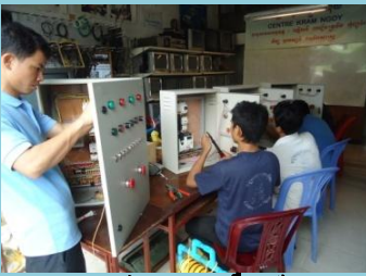
តម្លើងទូរបញ្ជាឈ្មឿនម៉ូទ័រ