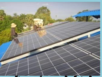
តម្លើង Solar ចែកចាយអគ្គិសនីក្នុងភូមិ