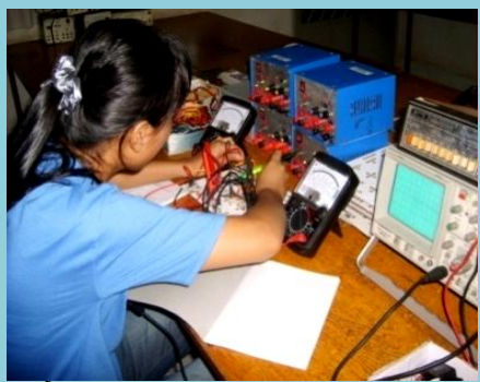
សំបូរគ្រឿងគុណកម្ម និងសំភារៈឧបទេស Riich Didactics Tools

ព័ត៌មានលំអិត: មជ្ឈមណ្ឌលក្រុម ជ័យ 58A ផ្លូវ 318 សង្កាត់ទួលស្វាយព្រៃ II ភ្នំពេញ (ចំងាយ 300m ខាងលិចផ្សារអូឡាំពិច) ទូរស័ព្ទលេខ : 023 987 843 / 011 748 983 / 011 820 869 Email : ptm.ckn@online.com.kh / Website : ckncambodia.org