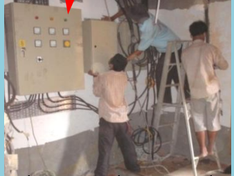
តម្លើងបណ្តាញអគ្គិសនីនៅសណ្ឋាគារហូលីដេ