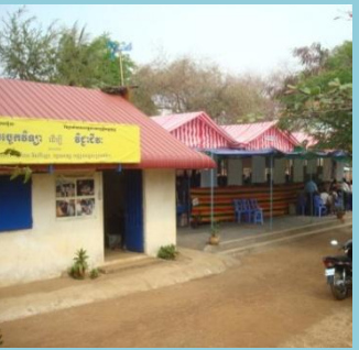
CKN ព្រៃទទឹង CKN at Prey Totung