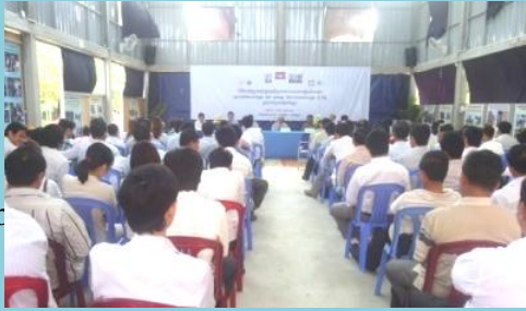
ពិធីបែកវិញ្ញាបនបត្រដល់សេវាករអគ្គិសនីទូទាំងប្រទេស