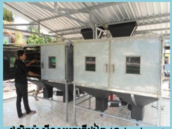
ផលិតម៉ាស៊ីនសម្ងួតត្រីរៀត (Solar dryer )