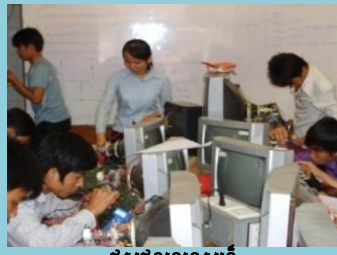
ជួសជុលទូរទស្សន៍