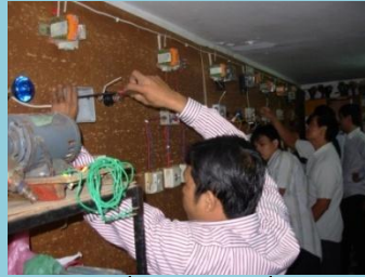
តម្លើងបណ្តាញអគ្គិសនី