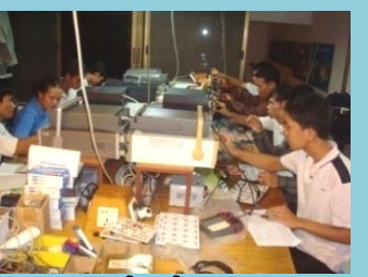
អេឡិចត្រូនិចអនុវត្ត