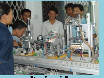
តម្លើងប្រព័ន្ធអូតូម៉ាទិក