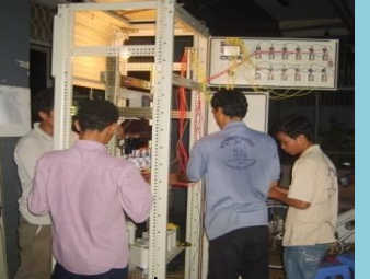
តម្លើងខ្សែកុងដងឲ្យរោងចក្រចំណីសត្វ