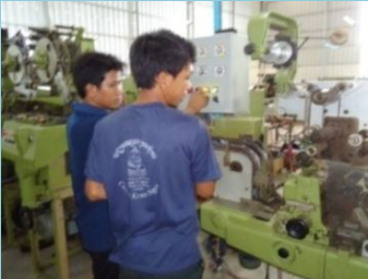
តម្លើងម៉ាស៊ីនខ្ទប់បារីនៅកំពង់ចាម