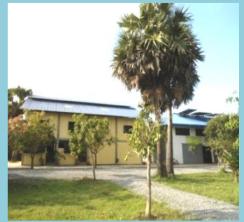
CKN សៀមរាបកន្ទួត P at Siemreap Kantout