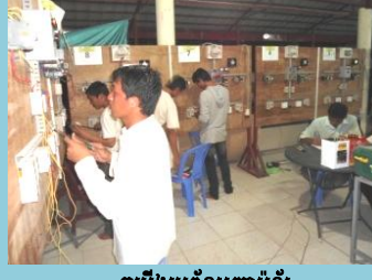
តម្លើងប្រព័ន្ធបញ្ជាម៉ូទ័រ