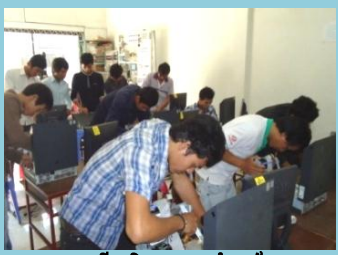
តម្លើង និងជួសជុលកុំព្យូទ័រ