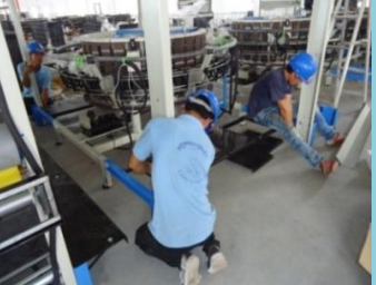
តម្លើងម៉ាស៊ីនបញ្ជាស្លឹកនៅចោមចៅ