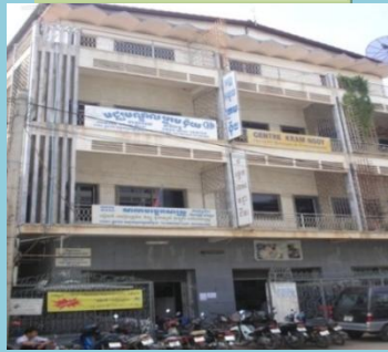
មជ្ឈមណ្ឌលក្រុម ជ័យ ភ្នំពេញ CKN PPhn