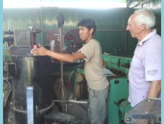
តម្លើងឧបករណ៍ម៉ាស ( Gasifier )