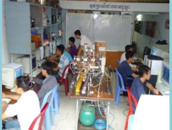
សរសេរកម្មវិធីបញ្ជាប្រព័ន្ធអេឡិចត្រូនិច